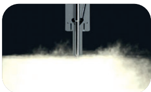
Mit PremiumDiesel ecoDrive.

Immer präziser konstruierte und leistungsstärkere Dieselmotoren sind auf eine Minimierung von Ablagerungen an den empfindlichen Einspritzdüsen angewiesen, um ihre volle Leistungsfähigkeit und Verbrauchseffizienz zu entwickeln. PremiumDiesel ecoDrive bietet mit der Clean up- und Keep clean-