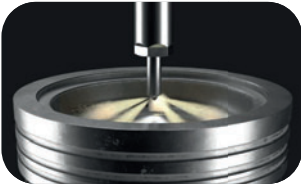
Mit PremiumDiesel ecoDrive.

PremiumDiesel ecoDrive hält die Einspritzdüsen sauber und reduziert so den Verbrauch. Zudem