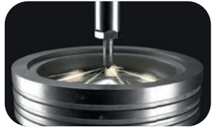
Ohne PremiumDiesel ecoDrive.

steigert die erhöhte Cetanzahl die Verbrennungsintensität und optimiert zusätzlich die Energieausbeute. Bessere Zündfreudigkeit – auch bei Kälte: ein Vorteil gerade in der Startphase. Gleichzeitig entlastet PremiumDiesel ecoDrive die Umwelt: Durch die effizientere Verbrennung werden Rußemissionen und andere Abgase deutlich verringert.